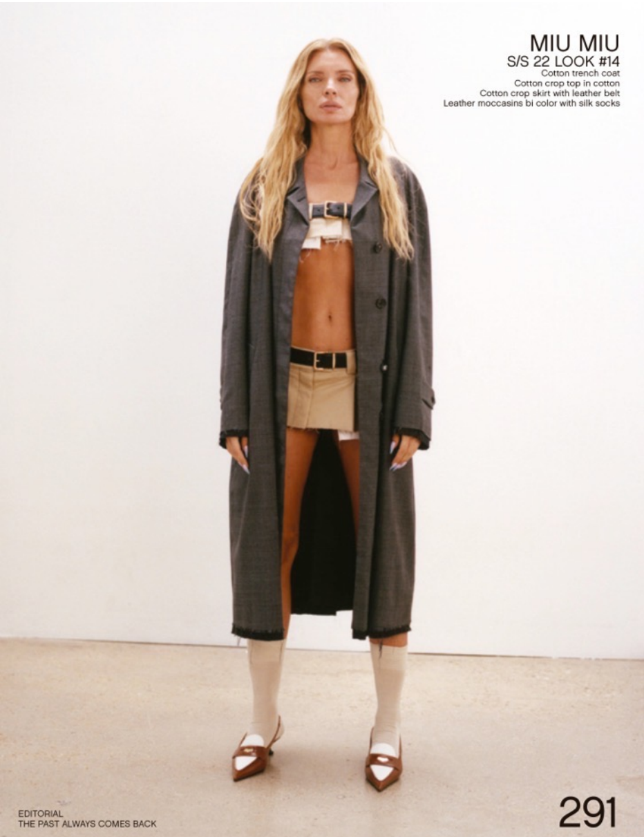
MIU MIU S/S 22 LOOK #14 Cotton trench coat Cotton crop top in cotton Cotton crop skirt with leather belt Leather moccasins bi color with silk socks